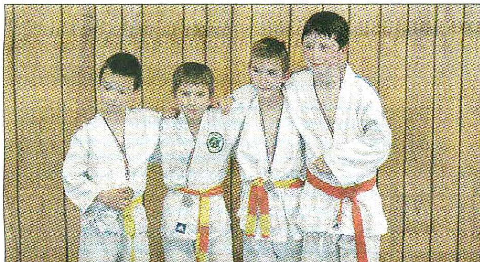
CEINTURES. Les quatre médaillés ont reçu les félicitations du club et ont réussi grâce aux efforts de l'entraînement.

Cinq Vicomtois combattaient pour le challenge des « Petits Tigres » à Puy-Guillaume le vendredi 21 mai.