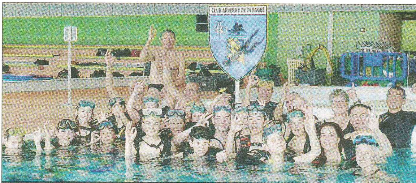
PLONGÉE. Une grande découverte pour les jeunes du centre de loisirs qui ont su apprécier tous les moments.

Après la prise en compte du matériel de surface (palmes, masque, tuba), une évaluation des compétences de base a été organisée.