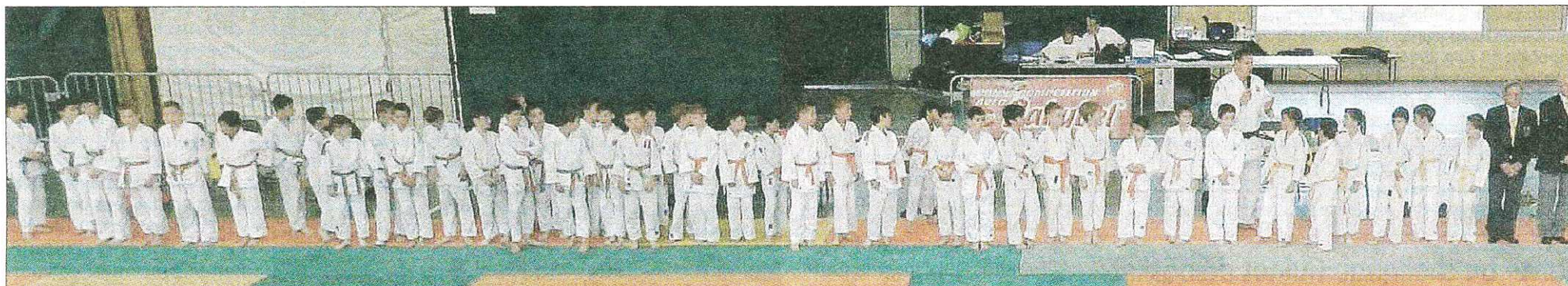
TOURNOI JEAN-COULOMB. Cent trente-huit judokas benjamin(e)s ont participé à cette deuxième édition du tournoi qualificatif pour le critérium régional.

Inscrit dans le circuit de qualification pour le critérium régional benjamin, sous l'égide de la Ligue d'Auvergne de judo, le deuxième tournoi Jean-Coulomb (ainsi baptisé en hommage au fondateur du