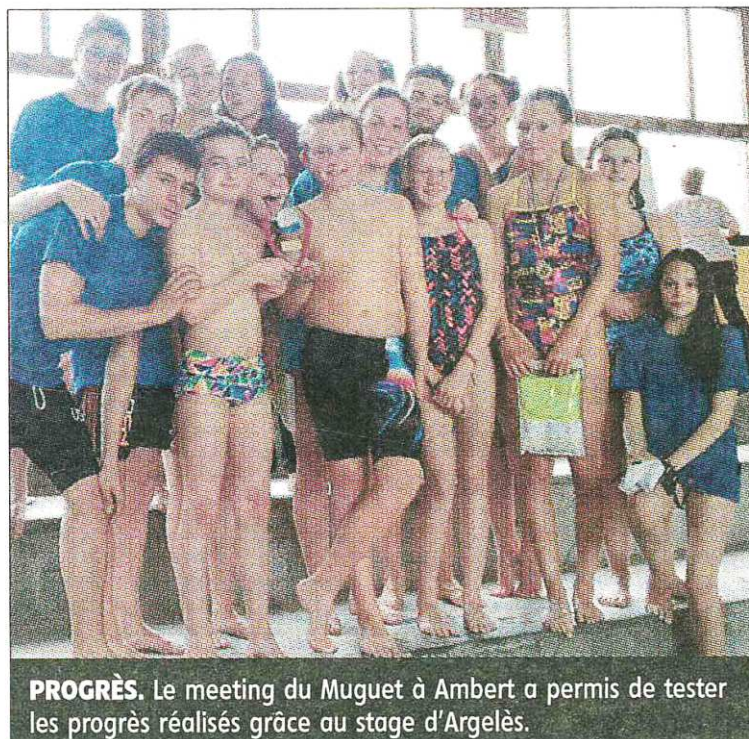
PROGRÈS. Le meeting du Muguet à Ambert a permis de tester les progrès réalisés grâce au stage d'Argelès.

Le stage à Argelès-sur-Mer, du 11 au 16 avril, a