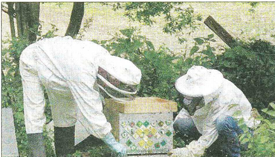
ESSAIMAGE. Deux nouvelles ruches seront prochainement installées dans la forêt de la Comté. Celle-ci a été décorée par les enfants de la garderie de la maternelle de Longues.

C'est le printemps et, avec lui, l'époque de l'essaimage des abeilles. Avec les adhérents de son atelier apicole, l'ADVEP a récupéré un essaim au local de la Truitelle, aux Orleaux.