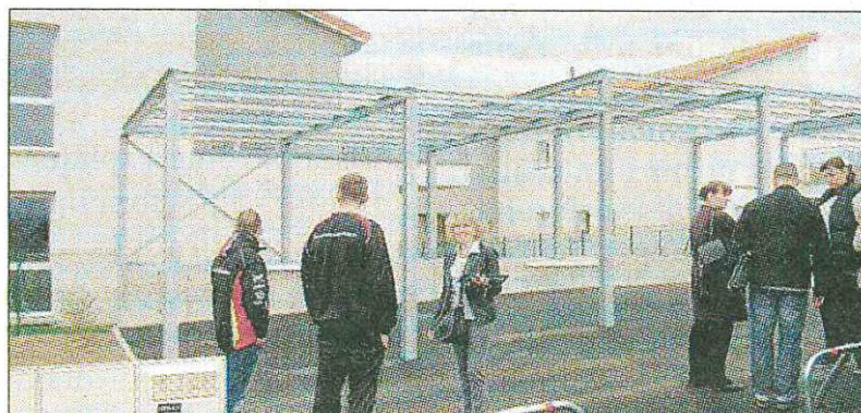
HABITAT. Huit nouveaux logements sociaux à loyers plafonnés ont accueilli leurs locataires.

Lundi 9 mai avait lieu la dernière remise de clé d'Auvergne Habitat à ses locataires des Treilles dans le nouveau quartier de Vic-le-Comte. Après les quatre appartements et le pavillon rue du Gamay, les quatre pavillons de l'impasse des Treilles, ce sont huit nouveaux logements sociaux à loyers plafonnés qui ont accueilli leurs locataires.