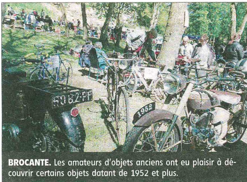
BROCANTE. Les amateurs d'objets anciens ont eu plaisir à découvrir certains objets datant de 1952 et plus.

Tôt dans la matinée, environ 70 exposants ont installé leurs étals sur le terrain de louche, dans une fraîcheur matinale inquiétante. Mais très vite, les amateurs de vide-greniers sont apparus.