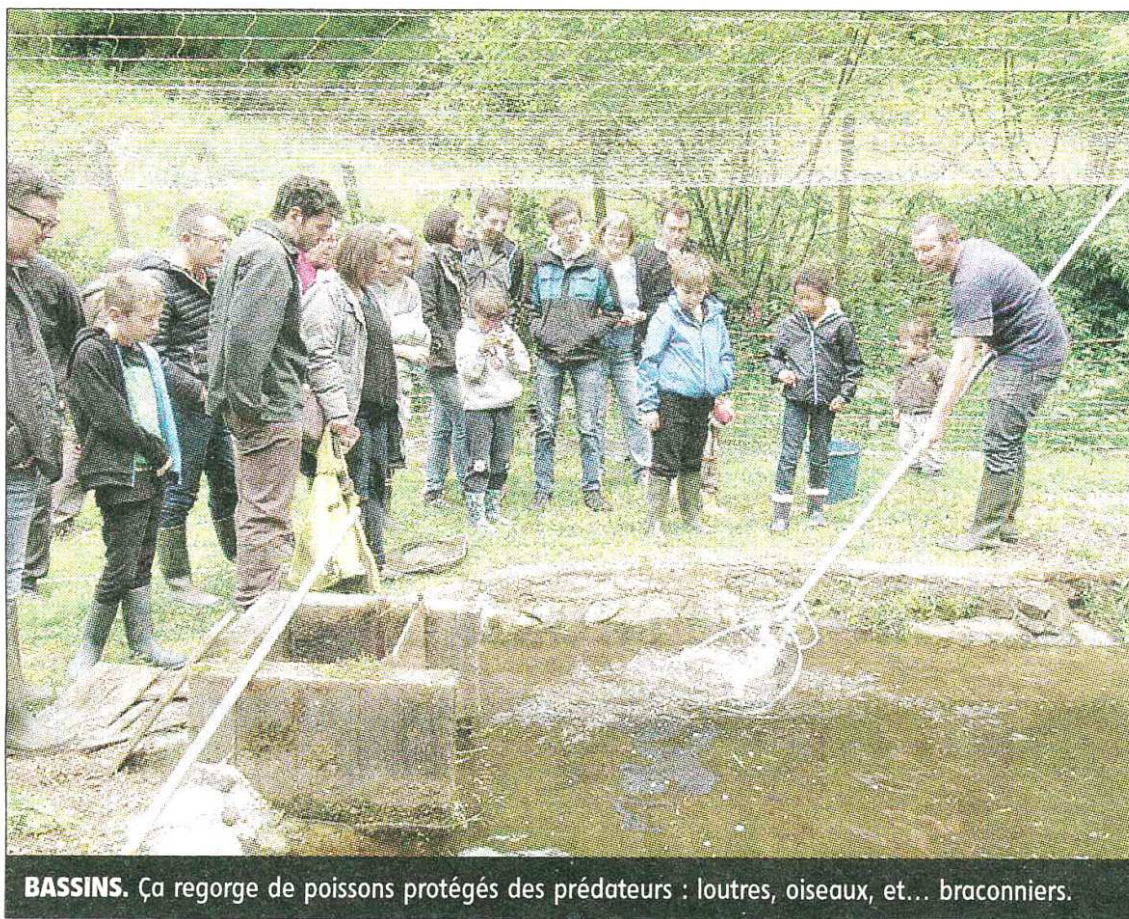
BASSINS. Ça regorge de poissons protégés des prédateurs : loutres, oiseaux, et... braconniers.

Les visiteurs s'en sont régalés, ainsi que des produits transformés (terrines, filets de truite fumés) et des mets que chacun avait apportés pour partager un savoureux repas. ■